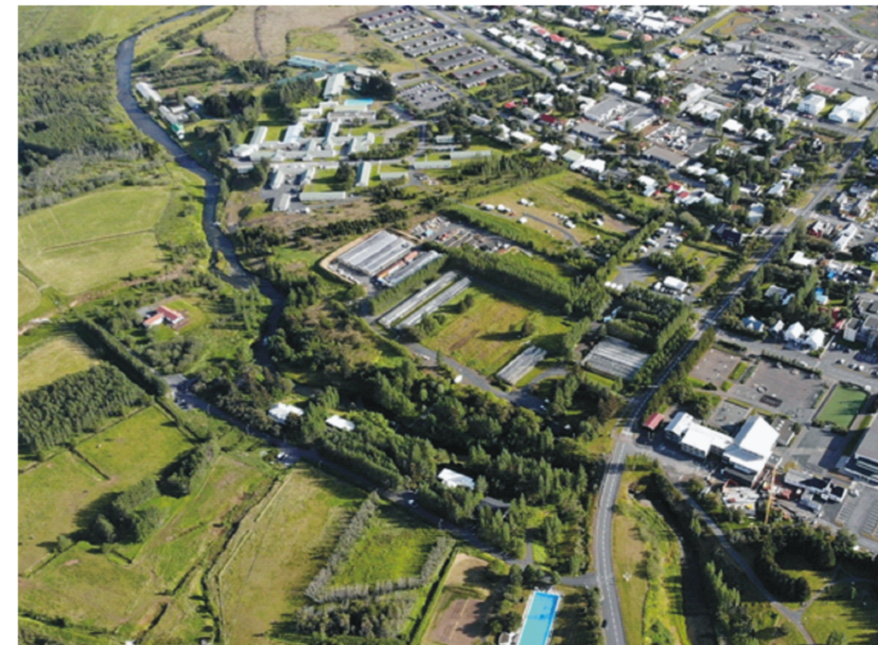
Séð frá norðri til suðurs yfir skipulagsreitinn

Aðalskipulagsbreyting þessi sem auglýst hefur verið skv. 31. gr. skipulagslaga nr. 123/2010 m.s.br. frá 7. mars 2022 til 22. apríl 2022 var samþykkt í bæjarstjórn Hveragerðisbæjar þann _____ 2022